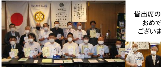
皆出席の皆さん おめでとう ございます!