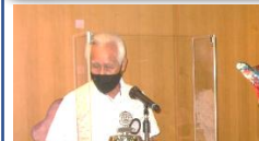
会員3分間スピーチ:粟田会員