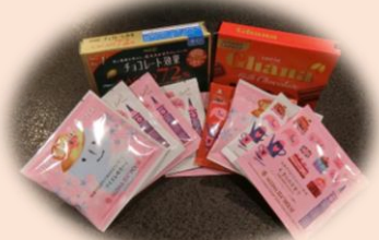
(↑)お菓子やお茶の御礼を頂きました。 ありがとうございます！