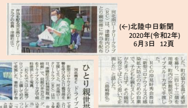
(←)北陸中日新聞 2020年(令和2年) 6月3日 12頁