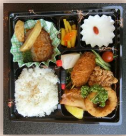
(↑)勝崎館特性弁当を 93世帯 273食を準備し配布