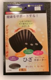
(↑)飯田会員による自社商品 ひざサポーター(ゲルマニウム 配合繊維製)も無償配布